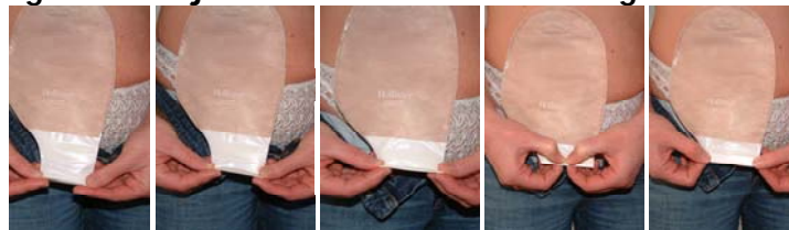
Openvouwen Ledigen 3x Vouwen Aandrukken Voelbaar dicht