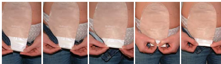
Openvouwen Ledigen 3x Vouwen Aandrukken Voelbaar dicht