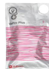
Ejemplo: Catéter VaPro Plus Pocket™*