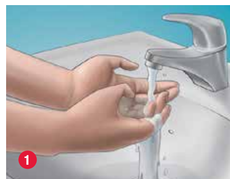
1 Lávese las manos con un jabón neutro y agua.

Cuando la vejiga no se vacía sola, podría recomendarse el AUI. El autosondaje se debe realizar bajo asesoramiento médico y únicamente de acuerdo con las instrucciones que se proporcionan. Implica utilizar una sonda para drenar la orina de su vejiga por la uretra. La orina debe expulsarse regularmente a lo largo del día para mantener el cuerpo saludable.