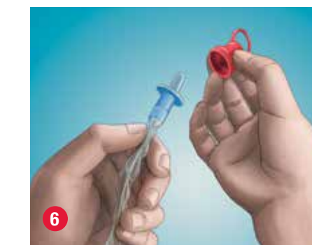
6 Retire el tapón rojo de la punta protectora de la sonda.