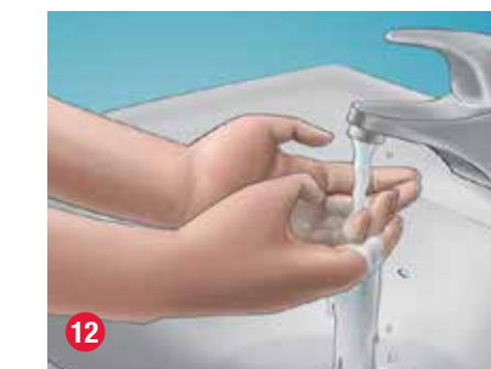
12 Lávese las manos con un jabón neutro y agua.