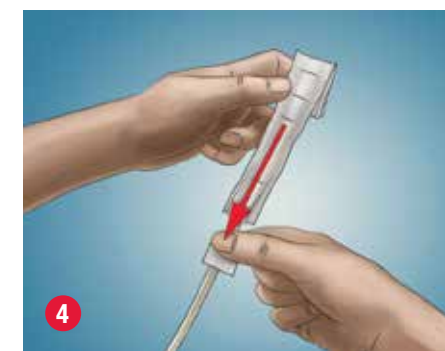
4 Para quitar la bolsa colectora, tire la banda de papel hacia la sonda y en dirección contraria a la bolsa para retirarla, o bien coloque la sonda en una superficie plana y, con la parte inferior del puño, despegue la bolsa de la sonda para liberar la banda de papel.