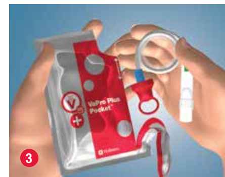
3 Saque la sonda del envase.