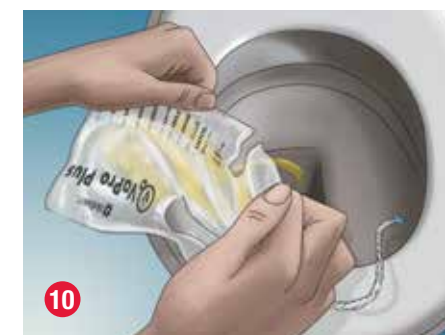
10 Para vaciar la bolsa colectora antes de desecharla, rásguela a la altura de la flecha (con la inscripción "Tear here to empty") para drenar la orina.