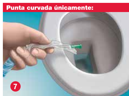
7 Dirija la vía de drenaje de la sonda hacia un receptáculo adecuado o un inodoro.