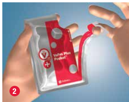
2 Para abrir el envase de la sonda, tire hacia usted del orificio para introducir el dedo, en la parte superior, al menos hasta mitad del camino hacia la parte inferior del envase.