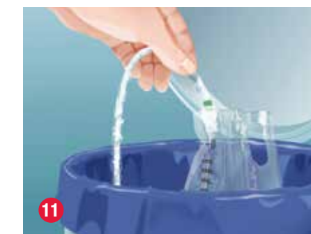
11 Puede desechar la sonda en una papelerera. No la tire en el inodoro.