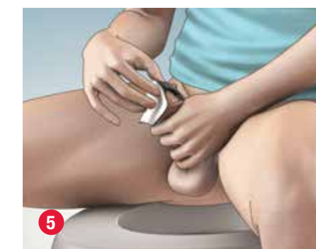
5 Sujete el pene. Desplace el prepucio (si lo hay) hacia atrás y lave el glande y el meato urinario con un jabón neutro sin perfume, o con una toallita húmeda sin alcohol.