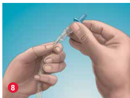
8 Sujete la sonda con una mano, y con la otra hágala avanzar hasta que la punta de la sonda alcance la punta protectora, teniendo la precaución de que la sonda no sobresalga.