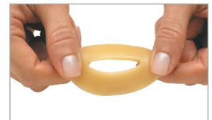
3 Estire para lograr un mejor ajuste.