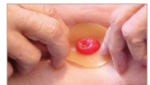
5 Coloque el anillo en la piel, asegurándose de que se ajusta donde se unen la piel y el estoma.