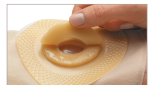
6 Apilar para lograr un mejor ajuste.