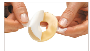
2 Retire ambos papeles antiadherentes.